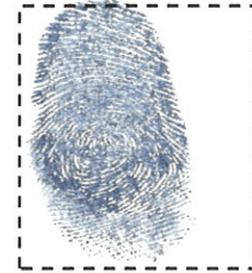
Huella Digital del Pulgar Derecho.