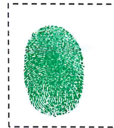
Huella Digital del Pulgar Derecho.