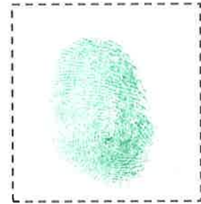
Huella Digital del Pulgar Derecho.